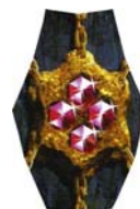
schakel 4 robijnen