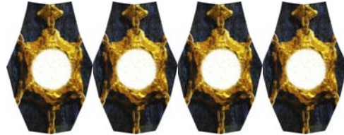
de 4 reservekaarten

Vooraleer met het spel te beginnen is het belangrijk om te weten welke onderdelen de meeste inkomsten opleveren en welke stukken interessant zijn om in te investeren. Die informatie vindt u op het overzicht.