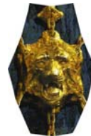
de leeuwenkop = joker

Bij het neerleggen van de vier bovenste kaarten moet er rekening worden gehouden met de regels van de reconstructie van het halssnoer. Bij discussie beslist de eigenaar van het spel.