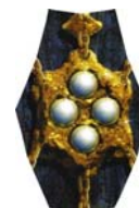
schakel 4 parels