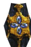
schakel 4 saffieren