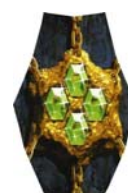
schakel 4 smaragden