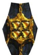
schakel 4 topazen