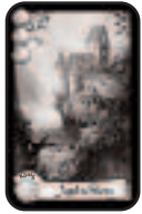
65 Bauwerkkarten 20 grüne, 12 gelbe, je 11 rote, blaue und lila Karten

von Bruno Faidutti, für 2 – 7 Spieler ab 10 Jahren