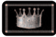
1 Kronenkarte mit Standfuß