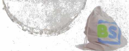
cotton bag included