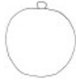
Apfelsine, orange (grüner Stiel)