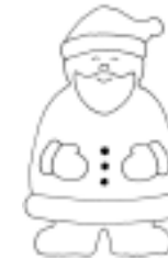
Weihnachtsmann, rot/ weiß